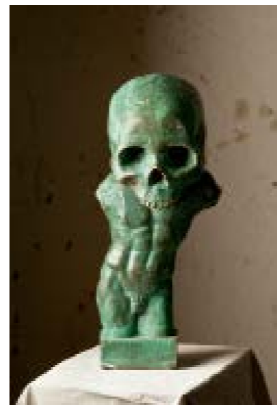
Man med fel huvud