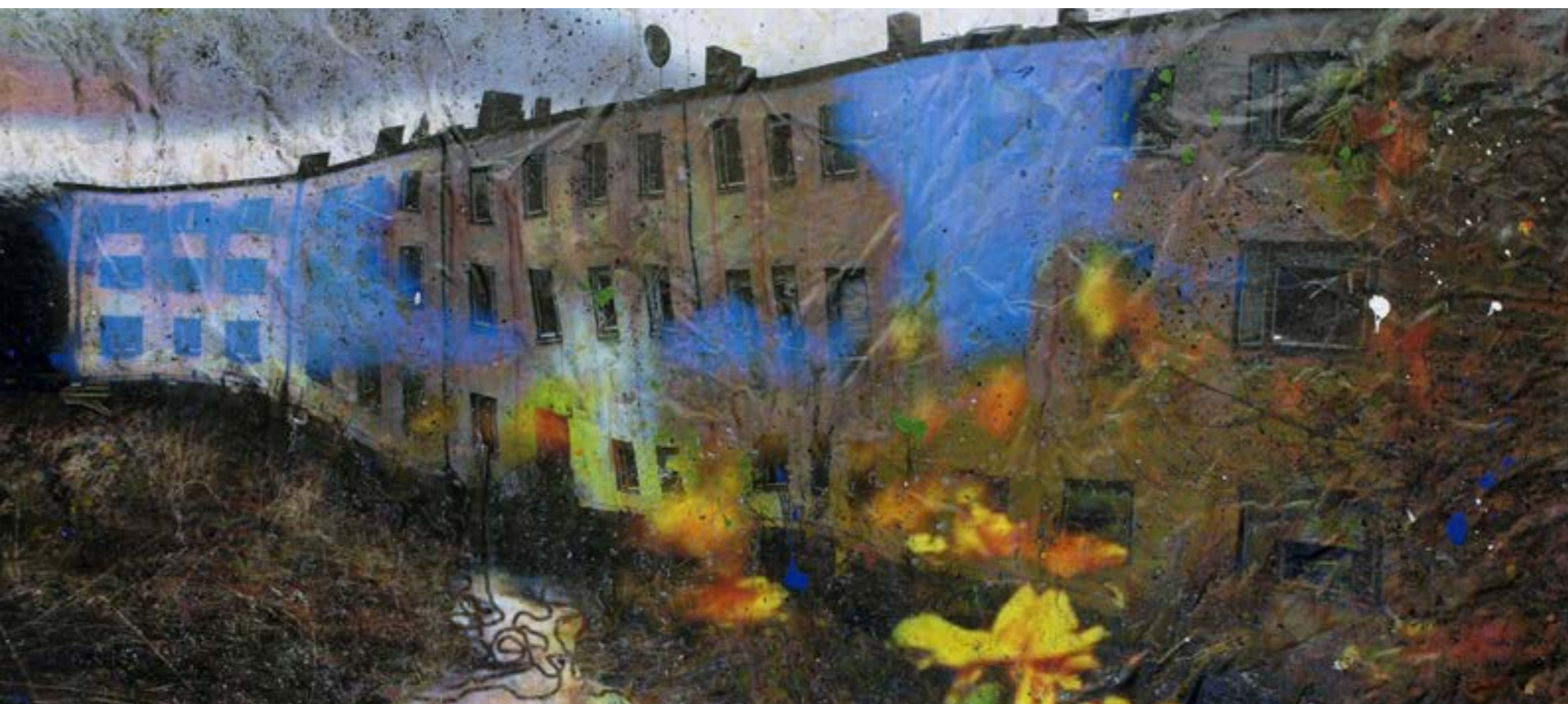
Once upon a time over Studsvik

Sedan kom konstkraschen, baksmällan, ett svårare men på många sätt intressantare 1990-tal. Bilderna blev mer sammanhållna, om än fortsatt råa, inspirerade av gatans språk. Gåtfulla siluetter tog plats på de förmörkade du-